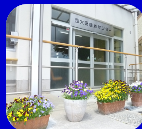
西大田自治センター

地区民体育大会・西大田で遊ぼう会・西大田走ろう会 さわやかスポーツ教室・八十八ヶ所巡りウォーキング 世代間交流事業・ふれあいサロン・敬老記念品配付 友愛弁当配付・ふれあい訪問・人権講座 新しい西大田を語る会・料理教室 等