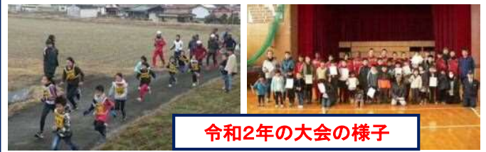
令和2年の大会の様子